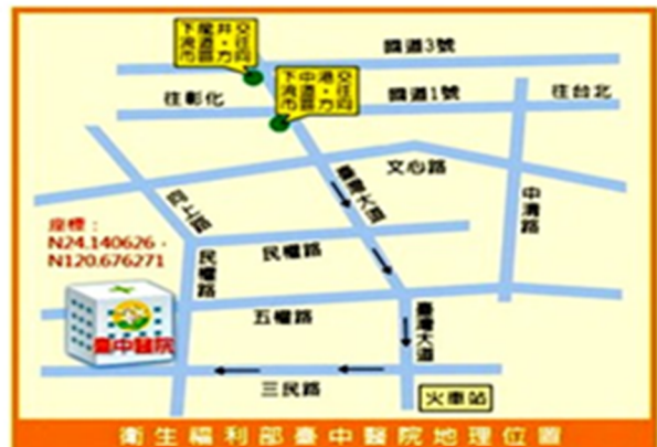
衛生福利部臺中醫院地理位置圖